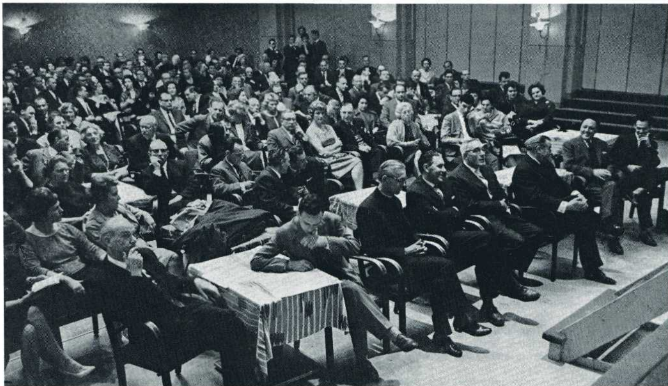
De zaal tijdens de feestelijke slotavond. Op de voorgrond de jury.

Deze avondmaaltijd en de daarop volgende voorstelling van Belgische amateurfilms in het Gevaert-theater kenmerkten zich door een zeer vriendschappelijke sfeer; er werd over de gezamenlijke liefde voor de film gesproken, gedachten werden uitgewisseld, kortom: de Belgische en Nederlandse amateurfilmers die daar tezamen waren hadden elkaar gevonden.