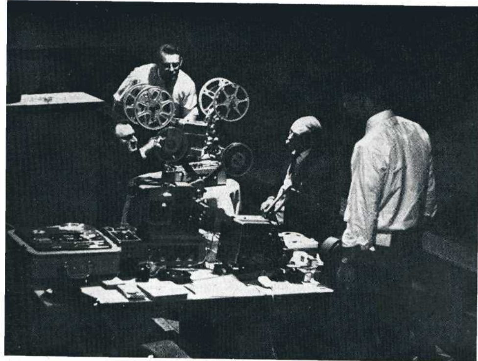
Op het halfduistere balkon werd koortsachtig gewerkt om de projecties vlot en zonder storingen te doen verlopen.

Wij kregen een reeks uitstekende Antwerpse amateurfilms te zien: 'Japan' van Walter A. Seys, een fraaie impressie van enkele aspecten van het Japanse land en — goed gedaan! — ook van het Japanse volksleven; 'Schelderijkdom' van Marcel Verbruggen, een prachtig gefotografeerde film over het vogelven in het gebied van de Scheldemonding; 'Kreatie in Keramiek' van Rik Kuypers, een in menig opzicht experimentele film over het werk van de kunstenaar Peeters, en tot slot de ronduit schitterend vervaardigde, van een kostelijke humor doortrokken films 'Nocturne' en 'Gebroken Hart' van Emiel Wouters.