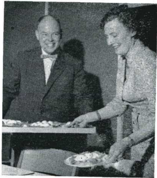
De U.S.A. was bij de bediening der zeer goed gemonteerde schotels voor de lunch bijzonder op dreef