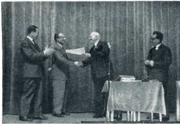
De Zilveren Bruigom op het podium