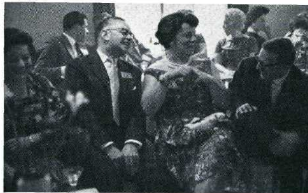
Reuze-stemming bij de ontvangst