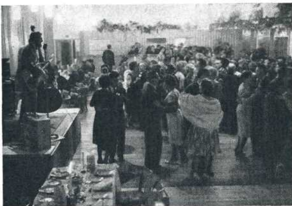
Links: De zaal vol feestvreugde.