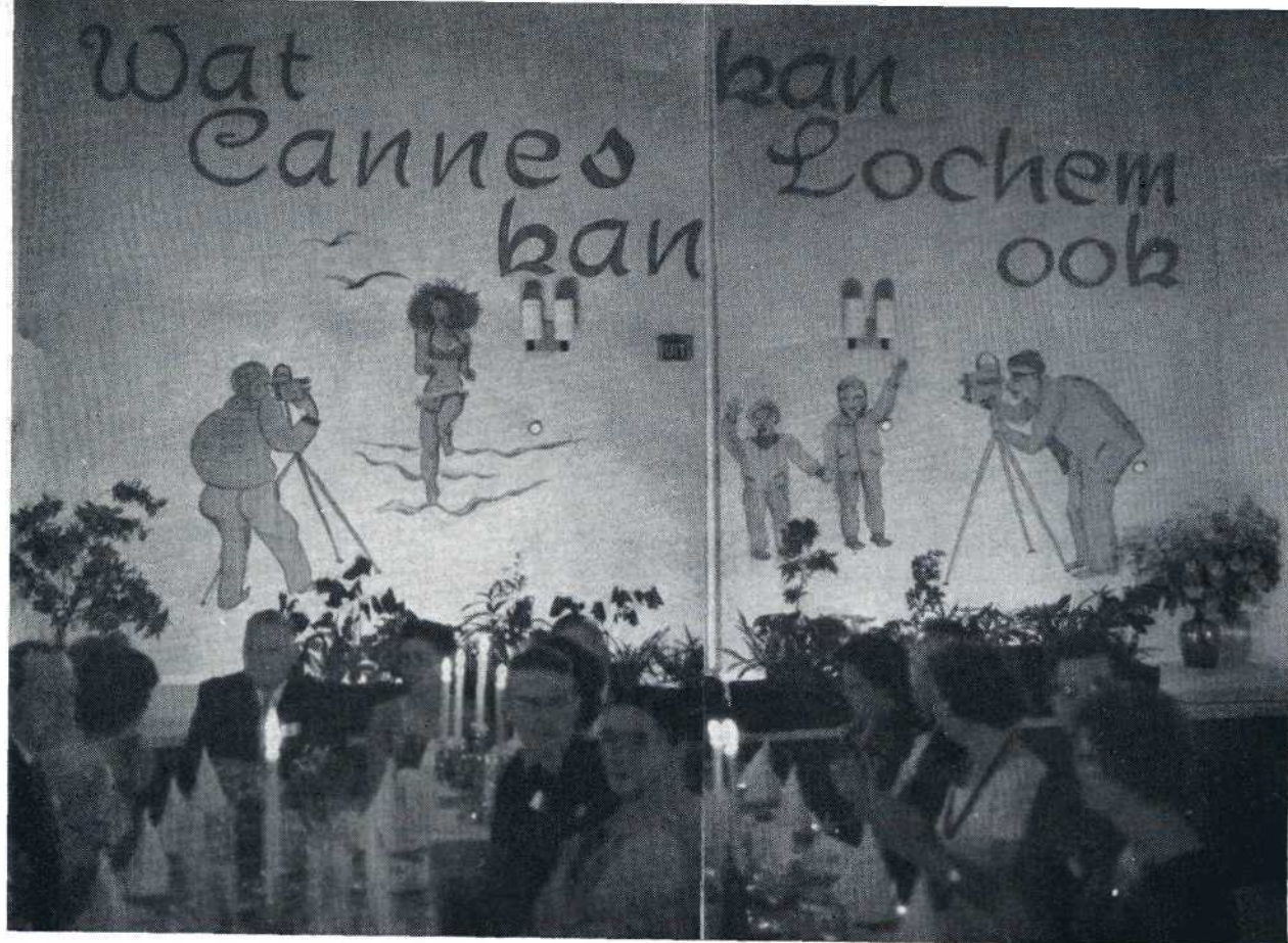
De achterwand van de feestzaal