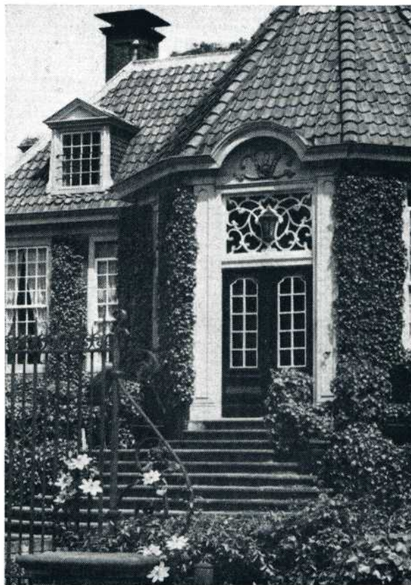
Detail van Kasteel 'De Wiersse'

De zaal bleek zeer geschikt voor een feest. Het eten was best, de soep zelfs goed warm, en de stemming dus prima, tot laat op de avond toe.