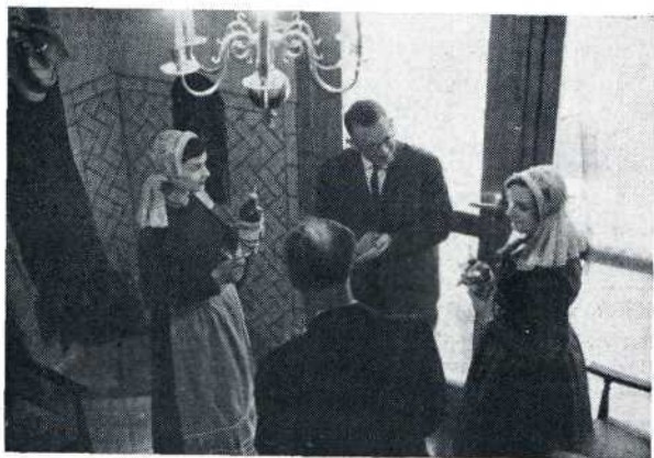
De vrolijke entree