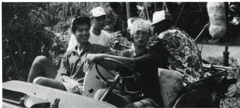
Het is altijd belangrijk om tijdig toestemming te vragen op locatie te mogen filmen en zowel de directies van motel Akersloot als De Nieuwe Slof verleenden alle medewerking om een succes te maken

DE KOSTEN zijn afhankelijk van de gekozen vorm. Er komen wat kleine kosten aan te pas, o.a. een S-VHS-cassette en enkele rekwisieten. Over vergaderkosten, catering en reiskosten wordt in dit geval verder niet gesproken. De meeste kosten gaan echter zitten in het laten kopiëren van de ca 125 films: cassettes, doosjes, etiketten, inlays en arbeidsloon. Omdat rechtstreekse distributie (enveloppe + porto) per film ca f 6,35 bedraagt, is gekozen voor het distribueren naar de clubs door de aangesloten organisaties (zoveel mogelijk tijdens de festivals). Voor de aangesloten organisaties die hun festival al gehouden hebben, is een andere oplossing gevonden.