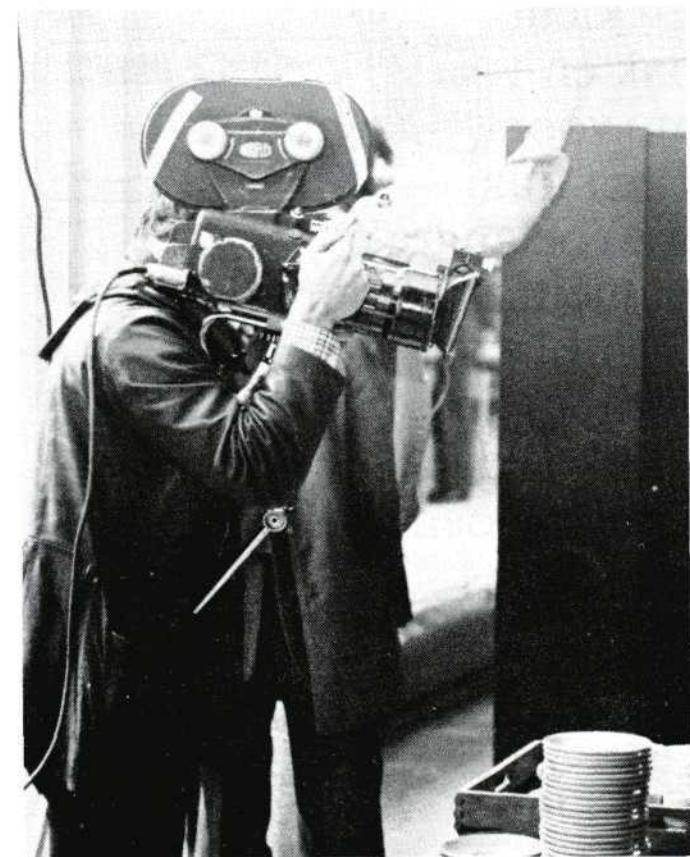
Van Gewest to Gewest op bezoek.

een dosis imitatie-romantiek en een stuk vrijblijvendheid en geengageerdheid naast elkaar. Soms kwalijk moraliserend in Beat waar de klassieke muziek de beat ging vonnissen, maar ook technisch knappe animatiehoogstandjes, zoals in dezelfde film en een eerlijke weergave van Een kunstenaar in blik.