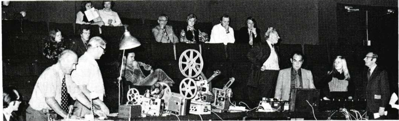
De 10-jarige technische commissie.