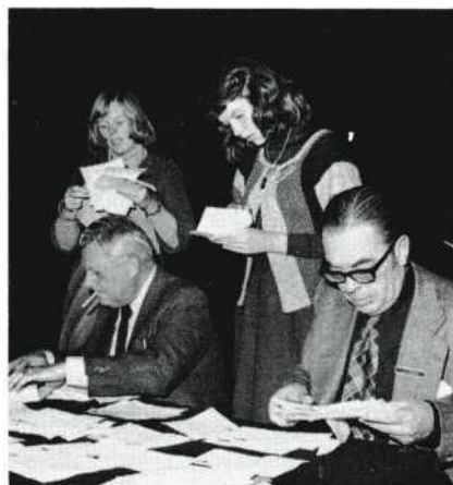
Stemmen tellen voor de zaalprijs.