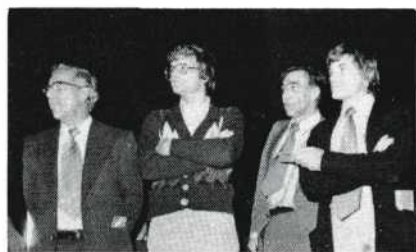
Enige 'Ten Best' filmmakers.

Tenslotte een woord van waardering voor de inspanningen van het projectieteam dat kans zag de projectie op een vlekkeloze manier te laten verlopen.