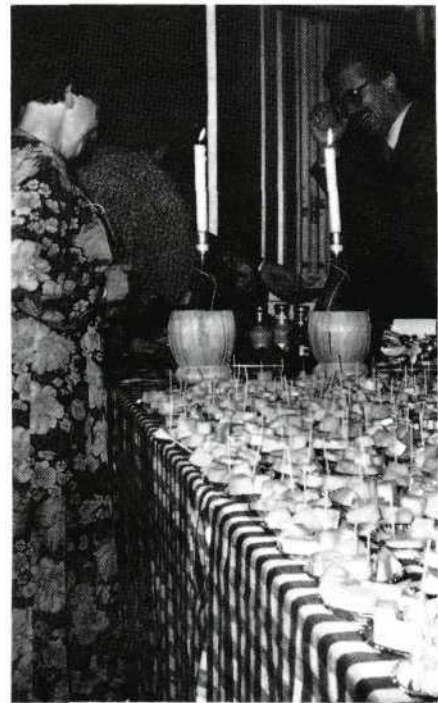
Alle districten betoonden zeer gewaardeerde activiteiten.

Misschien kan hier de Siofók-Unica ervaring nog dienstig zijn.