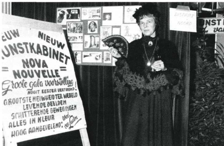
Het kunstkabinet mocht zich in grote belangstelling verheugen.

lokaal in opperste staat te brengen en erg veel gasten uit te nodigen.