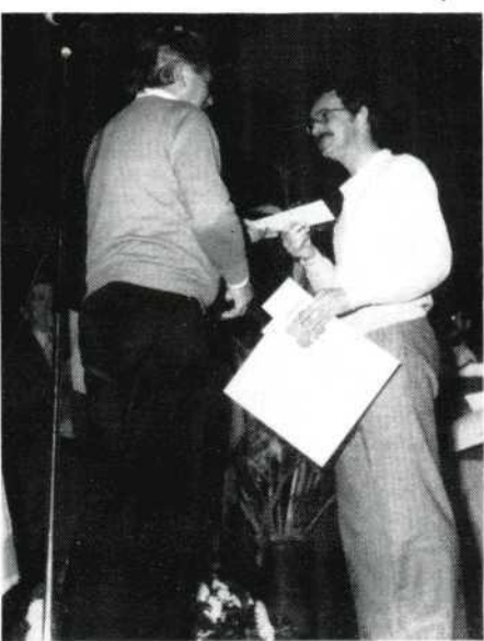
Uitreiking van de Publieksprijs aan de maker van de film 'Terreur op recept'.