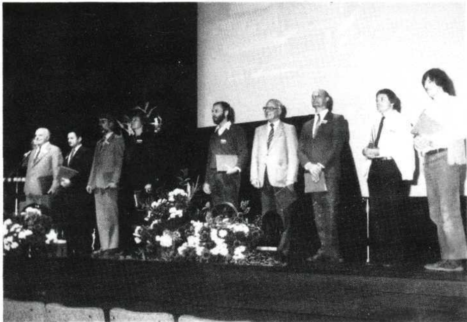
De jury bestond uit 9 leden, die ieder een NOVA-district vertegenwoordigden.

'In groeven gevangen', documentaire van Barend de Vries (Rotterdamse Smalfilm Liga);