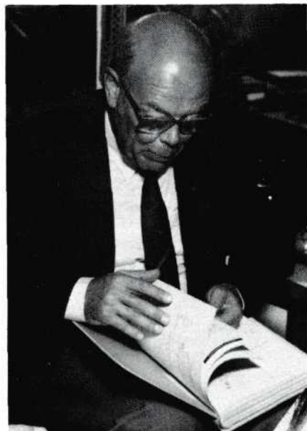
Jan: 'De mens is in principe als creatief wezen geboren'.

D.B.: Elke dag. Ieder nieuw boek dat er verschijnt, werk ik nog zelf bij en ik wil ook zelf de correctie doen. Dit is de 22ste