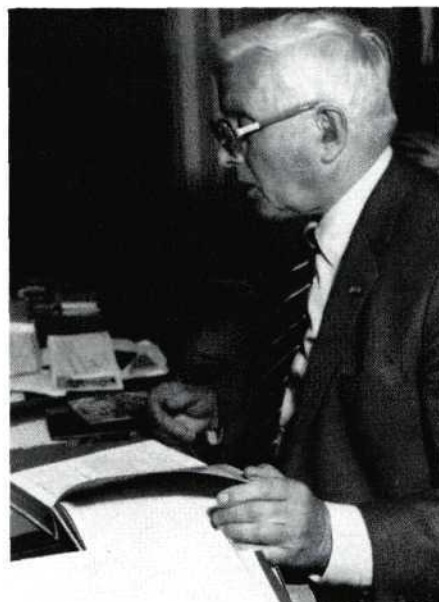
Dick: 'Wat de techniek betreft: ik weet niet of video het zal winnen, maar de smalfilm zal blijven bestaan'.

J.D.: Als je over een omwenteling praat, zul je altijd moeten praten over totaal nieuwe concepten. Of die geluidskoppen nou beter worden of er komt een beeldplaat, dat blijft sleutelen aan een concept. We kregen stoomtreinen, toen betere stoomtreinen, maar het bleven stoomtreinen. En dat werd pas anders, toen er elektrische treinen kwamen. En ik geloof, dat het met de filmerij net zo is. Wat het precies gaat worden, daar heb ik geen idee van. Want als je beeldplaat zegt, dan is dat voor mij video, maar alleen rond. Dus hetzelfde concept in een andere vorm.