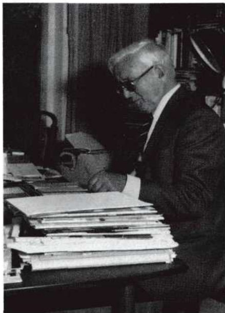
Nog dagelijks doende met herdrukken van boeken.

T.S.: Waren de commerciële mogelijkheden in de fotografie toen niet groter? Ik bedoel als uitgever gezien?