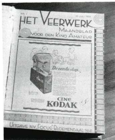
Eerste nummer van Het Veerwerk.

statige houten trappen en al die panelen. Het was een voornaam gebouw, het had een onmiskenbare stijl.