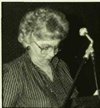
De nieuwe voorzitter tijdens haar aanvaardingsspeech.

Het aanhouden van de vrij vroege datum in een kalenderjaar bleek de penningmeesters en het NOVA-kantoor flink onder druk gezet te hebben. Aan de verslagen was dat niet te merken. De financiële gegevens waren meer van toelichting voorzien dan in voorgaande jaren.