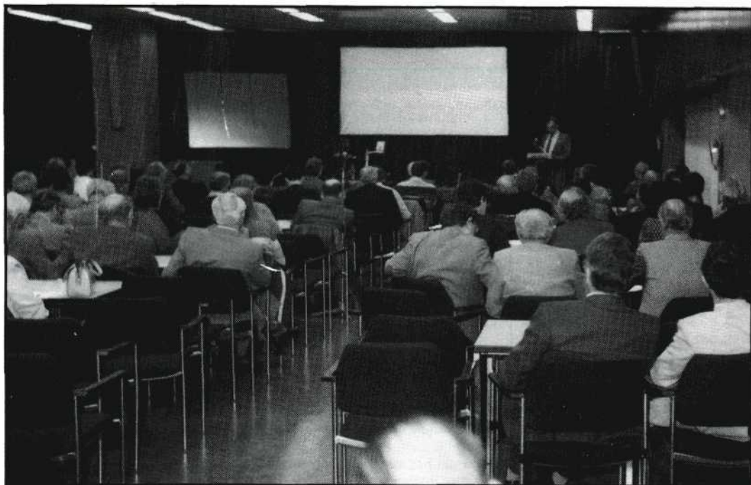
De harde kern van de Nederlandse amateurfilmers luisterde met grote aandacht naar de sprekers.

Rondom de lunch werden een aantal Telecine-adaptors gedemonstreerd, waarmee 8 mm films op video kunnen worden overgezet en hier oogstte het