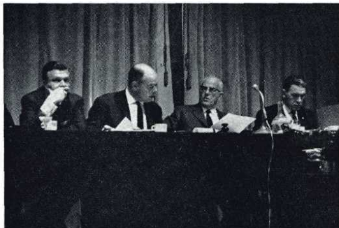
Vijftien jaar op deze plaats!