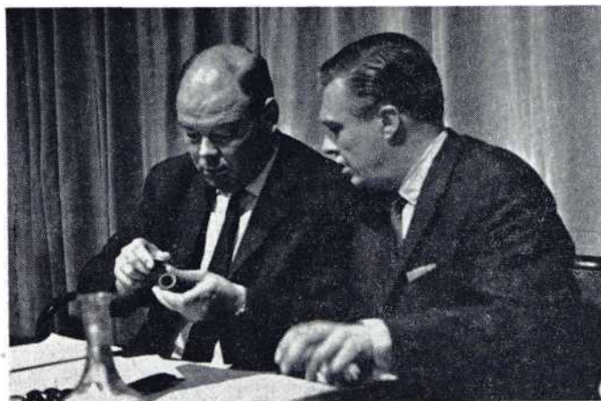
De eerste aandacht van de nieuwe voorzitter gold — na alle drukte — de pijp van zijn secretaris.

organisatie verricht had het erelidmaatschap aan te bieden. Met luid applaus onderstreepten de aanwezigen dit eerbewijs aan de scheidende voorzitter.