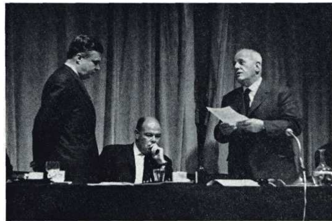
Zijn opvolger wijzend op wat te wachten staat.