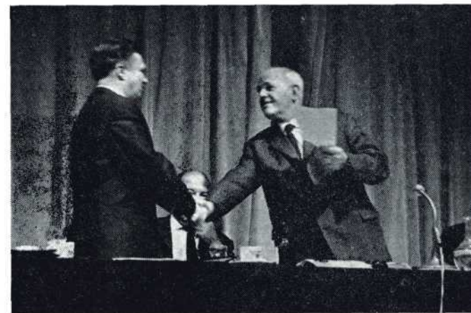
Een handdruk sloot een tijdperk af.