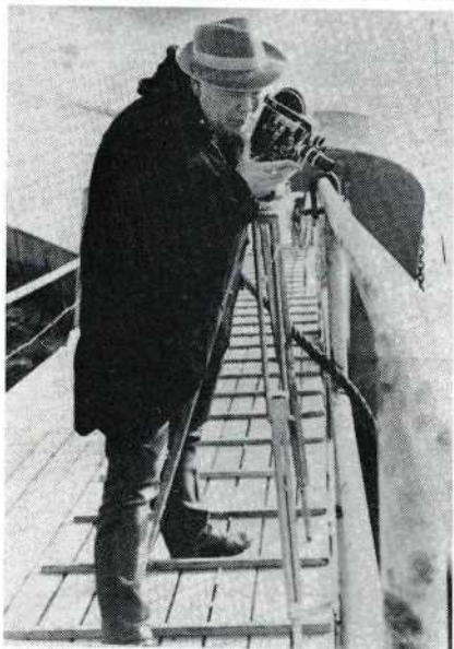
Bij het filmen van 'Zee, steen, asfalt'.