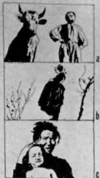
Fig. 18 - Documentaire film - reportage film.

Het laatste hoofdstuk is gewijd aan: filmtechnische tekortko-