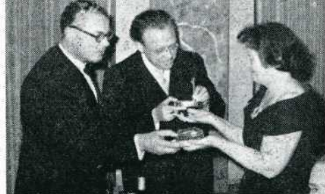
Uitwisseling van souvenirs

Speelfilm: „Het Bezoek” 57,31 13e uit 18 Genre: „Doedeldiedol” 61,62 11e uit 21 Documentaire: „Zomer in Zwitserland” 50,77 15e uit 18 Totaal Nederland: 169,70 13e uit 15 Aantal punten van het winnende land: 214,15