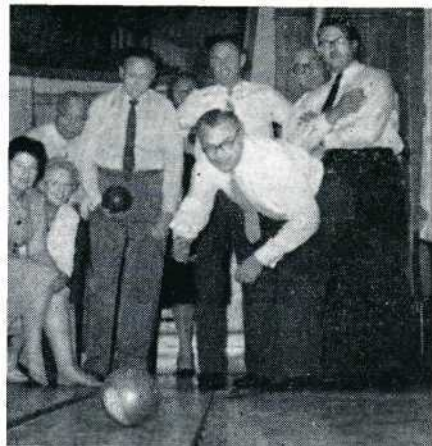
Tussen de films door een partijtje kegelen.

Betekent dat nu, dat we alles op alles moeten zetten om te proberen humoristische films naar de UNICA te sturen? Ik geloof dat dit wel iets te sterk uitgedrukt is, maar dat de internationale jury van de UNICA het hevige drama minder graag ziet dan een vrolijk luchtig geval, is wel duidelijk. Weliswaar is de beste film van het concours ('Das Letzte Konzert' van de Duitse filmers Rehage, Oswich, Vogelsang en Lenz) ditmaal een echt drama, maar numero 2 en 3 zijn puur kolder evenals no. 5. Dat 'Het Bezoek' van Moolenaar het hier dus beter deed dan 'Strijd' van de groep de Kinkelder is niet zo erg verwonderlijk. Humor is veel minder dan drama aan een bepaalde volksaard gebonden en wordt mits goed voorgedragen, door iedereen aan gevoeld zonder aan de intelligentie van de toeschouwers al te hoge eisen te stellen. En laten we niet vergeten dat in 1957 in Rome een humoristische speelfilm de eerste prijs haalde ('Kruispunt' van de Belg P. Wils) evenals in Zürich in 1956 ('De Avonturen van het Andere Ik' van de Italiaanse groep Candiolo, Moreschi en Marinuzzi). Zelfs de ouderwetse 'slapstickcomedy' waarmee de Zwitsers dit jaar in het krijt traden ('Eerlijk duurt het langst' van A. Beuninger) slaagde erin met 68,77 punten de derde