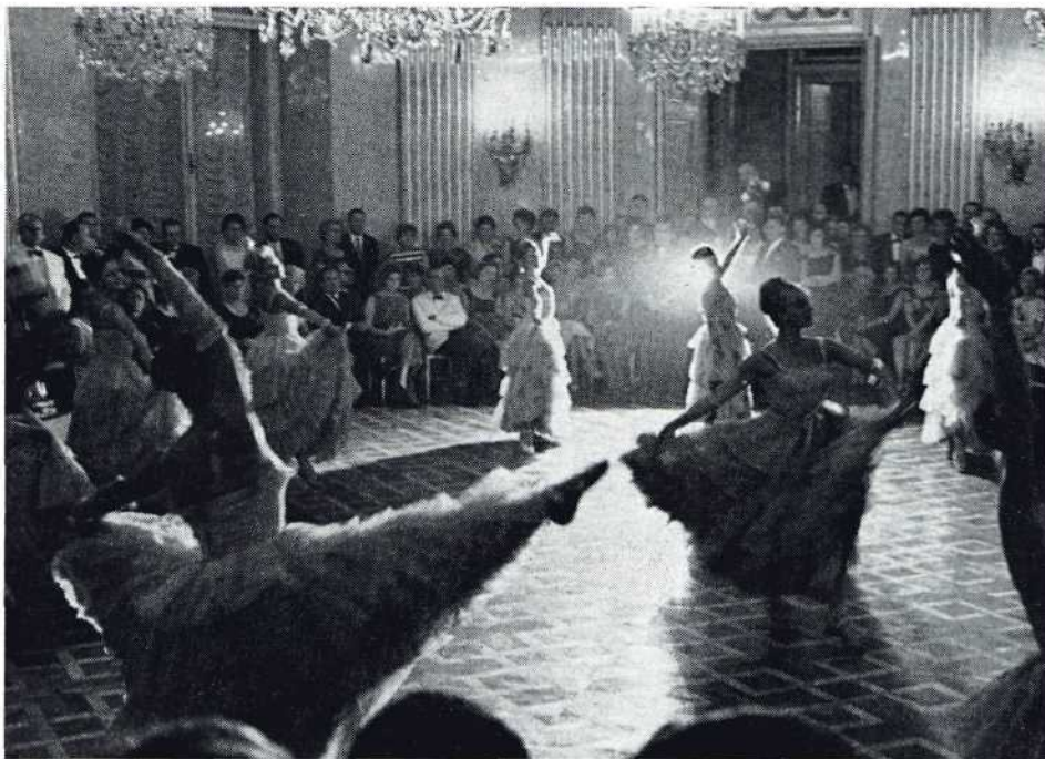
Een deel van het beroemde Operaballet van Wenen opende op sprookjesachtige wijze een sprookjesachtig bal

Op de vrijdag na de filmvertoningen stapten alle congresdeelnemers in een tiental autobussen om een grote tocht door het beroemde Wienerwald — met