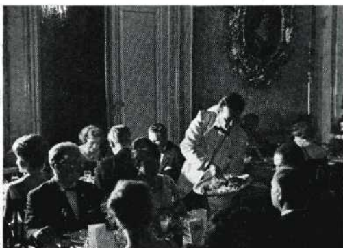
Slotbanket in het 'Palais Auersperg'

de beste plaats in het landenklassement aan Oostenrijk, de 'Gran Premio d'Italia' voor de tweede plaats aan België, de 'Coupe Fedic' voor de derde plaats aan Frankrijk, de 'Coupe Marechal' voor de vrolijkste film aan de makers van de Zwitserse film 'Notlandung', de 'Coupe de l'Esperance' voor het land dat de beste verwachtingen voor de toekomst wekt aan Denemarken, de 'Coupe Battistella' voor het meest originele scenario aan de Spaanse film 'Les Pommés et Nous' en de 'Coupe Tchecoslovaque' voor de film die het meest bijdraagt tot de broederschap tussen de volkeren aan de Argentijnse film 'Die Strasse erwacht'. De mededeling van het Oostenrijkse organisatiecomité dat de gouden medailles niet verguld, maar van zuiver goud waren (Maria-Theresiathalers) verwekte stormachtig applaus voor dit prachtige gebaar.