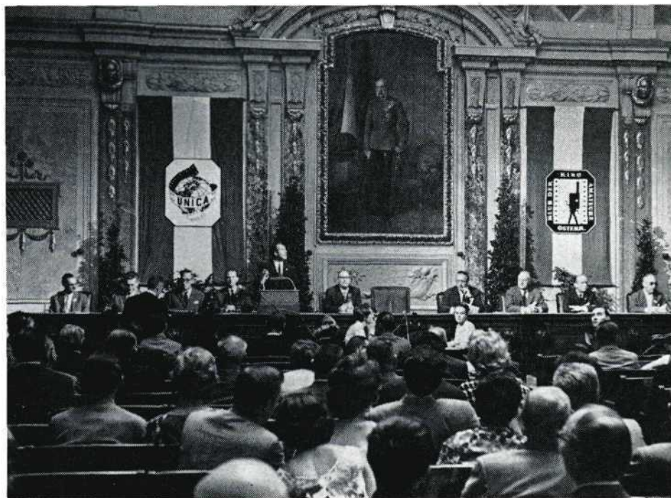
Goede toespraken van UNICA-VIP's tijdens de feestelijke opening onder het portret van Keizer Franz Joseph in de grote zaal van het 'Haus der Industrie'.

De 16 mm projectie — 80% van de films waren 16 mm's! — verliep over het algemeen feilloos, hoewel zich soms in deze zaal de behoefte aan nog meer lichtsterkte dan de Siemens-projectoren al opleveren, deed gevoelen; een wens die ook waarschijnlijk slechts door xenon-verlichting vervuld kan worden. Gedurende de gehele projectie is slechts