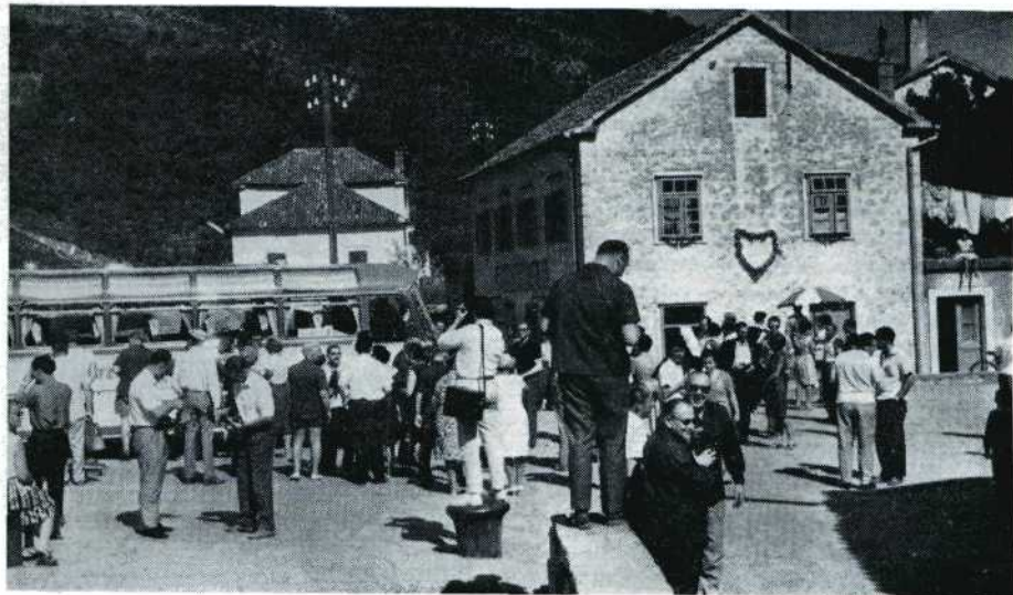
De UNICA-congresgangers op excursie door Montenegro.

hoord. Nadat ik aangedrongen had dat wij toch wel vreselijk graag de nacht onder een dak wilden doorbrengen, en verteld had dat wij bepaald niet uit Nederland kwamen om op een bank in een parkje te gaan slapen, streek men de hand over het hart nadat men eerst