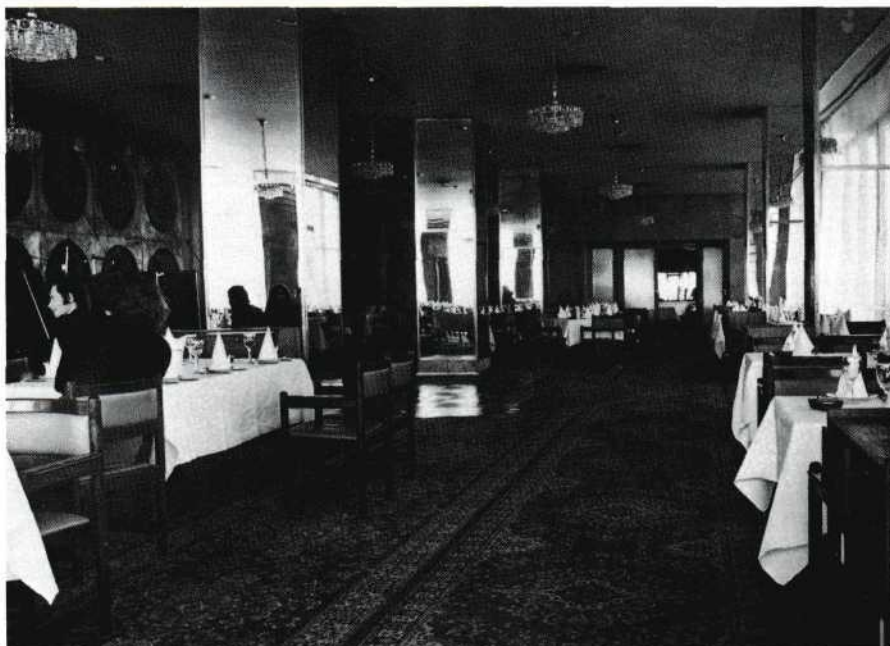
De Russische gastvrijheid staat er borg voor dat de inwendige mens beslist niet vergeten zal worden.