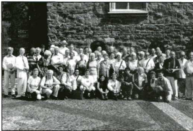
Het grootste deel van de Nederlandse deelnemers achter de kerk in het witte stadje Thorn

De ca 350 deelnemers en bezoekers hebben allen op eigen manier kunnen genieten van dit jaarlijks in een ander land te houden filmfestival.