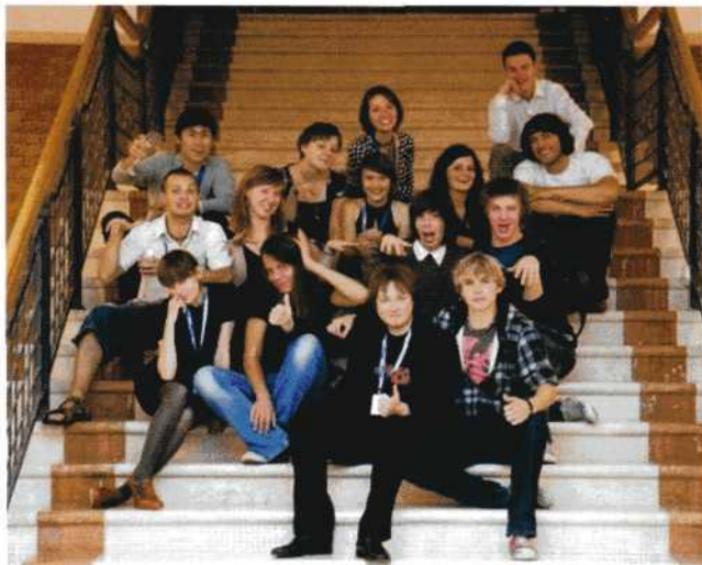
DE DEELNEMERS AAN JEUNESSE

De uitnodiging lag er al een poosje: deelname aan een filmfestival voor tien dagen in Polen, namens Nova Noord. De zomervakantie had ik al aardig ingevuld met het (af)maken van enkele films waar ik al een poosje mee bezig ben. Het nieuwe schoolseizoen was amper begonnen, of ik zat al op Schiphol te wachten op onze vlucht naar Warschau. Bijzonder aspect: ik had nog nooit gevlogen. Dat ging dus fantastisch.