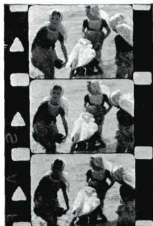
Uit de film „Zoutelande“ van D. Knecht.

De klasse B. werd dadelijk belang-rijker door de prachtige film van Carré en Scheffer „De Straat“. Dit was een zuiver do-cumentaire film, die toen grooten opgang maakte. D. Knecht met „Zoutelande“ won 'n 2en prijs