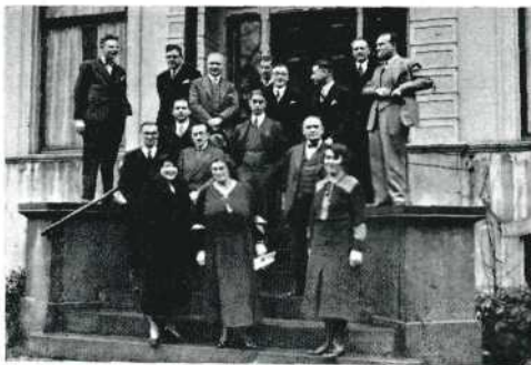
Jury en Hoofdbestuur op de stoep van de N.V. Multifilm.

Ridley, Engeland, die veel meer cultuurfilm, dan documentair was. Technisch waren de moeilijkheden groot, maar het resultaat toch zeer te waardeeren. Tenslotte de Fransche 9,5 m.M. speelfilm „Vendetta”, luchtig, vroolijk, geestig. Een echt amateur speelfilmpje, zonder de pretentie het „vakwerk’ na te willen doen, en juist daarom zoo frisch en boeiend. Dat men de echte amateurs juist in de 9,5 klasse moet zoeken, zooals een ver-