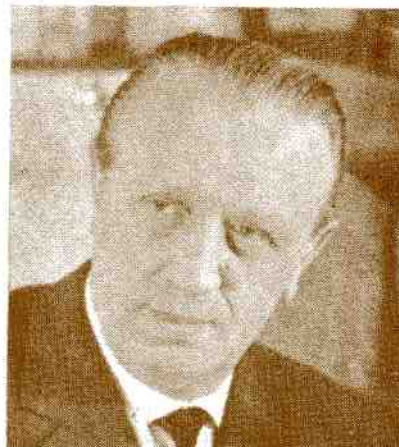
WILHELM HERRMANN (Allemagne) Präsident

Mit dieser Feststellung sind wir schon mitten im Thema, aus der sich die Frage ergibt, erschöpft sich die Tätigkeit der UNICA nur in der Abhaltung eines jährlichen Kongresses und Wettbewerbs, oder hat sie die Verpflichtung, eine Interessenvertretung des Filmamateurs und des Amateurfilms auf internationaler Ebene zu sein.