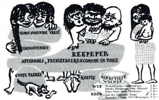
Het grappig getekende menu voor het feestdiner.