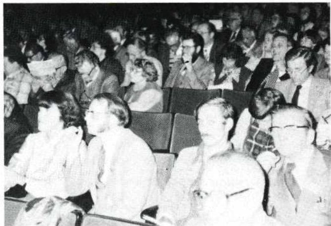
Enkele seconden voor de aanvang van de volgende voorstelling, ook deze lege stoelen zullen snel bezet worden. Honderden gasten, die op zondag er niet meer bij konden, vonden in een nevenzaal plek om aldaar ook alle films te zien. Een grandioze oplossing voor een nijpend probleem, dat dank zij vele uren extra (nacht)werk werd opgelost.