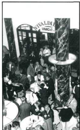
UNICA '96 tijdens de pauzes