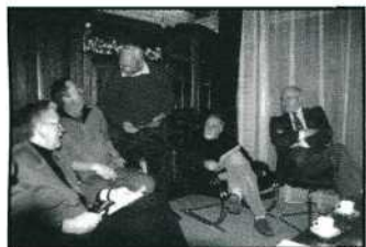
Het organisatiecomité van NB'80