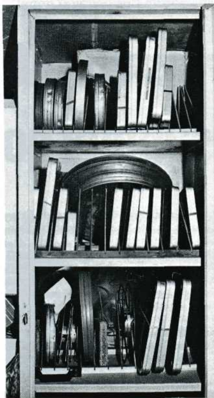
Een greep uit de NOVA-filmtheek

stempelvlaggen, nationaal en internationaal.