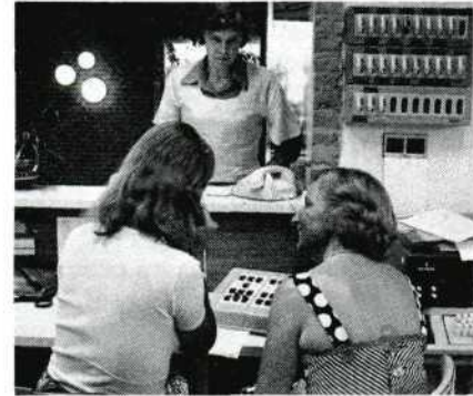
De 'centraal-post' in Groningen, voor het begin van de drukte.

'Een ieder kreeg haar of zijn instructies en ging', zo schrijft Filmbeeld-medewerker Frits van Echten, 'in afwachting van de telefonade aanschouwen hoe gemakkelijk het is op de tv buiten de 'STER' om reclame te maken voor Gazelle fietsen of haakse grasrandscharen.