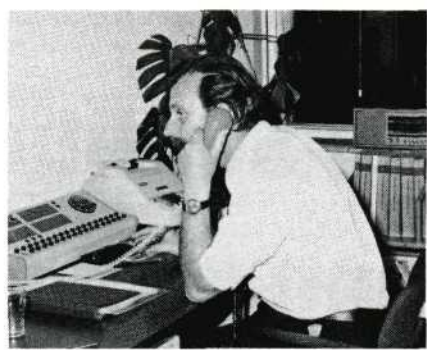
De centrale bij Van Baarsen in Amsterdam-Noord waar 14 medewerkers het 'aktiecentrum' bezetten.

ningen bij 'KEIP', zoals de leden van de Groninger Smalfilmers de zogenoemde firma gemakshalve aanduiden. Hier werden tien telefoontoestellen bemand door leden van bovengenoemde club en van de Asser Filmclub.