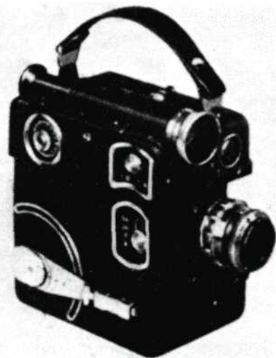
De Siemens camera F 11, 16 mm speciaal voor telelizen gebouwd, de zoeker kan worden ingesteld voor lenzen van 2,5 tot 10 cm brandpuntsafstand.

Voor 35 cent kocht ik triplex, waarop ik