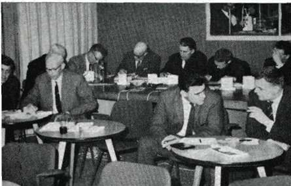
De selectieklasse-jury en enkele bijzitters