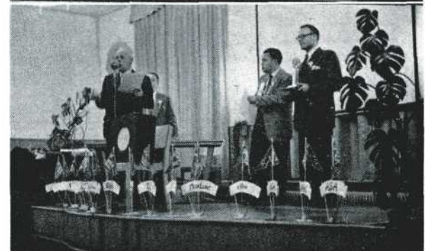
De prijsuitreiking in tafelen.

Alle foto's door de Veerwerk redactie, zonder hulpverlichting bij bestaande verlichting op Kodak Tri X.