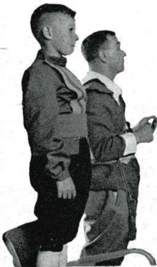
De Vendel-koning met de kroonprins

Toen kwam de lang verwachte smalfilmprojectie der bekroonde films. Geprojecteerd werd door de goede zorgen van fotohandel Veldman uit Tilburg. Tot veler verbazing stond er een 8 mm Siemens projector met . . . een booglamp van de Ampro Arc erachter! Daarnaast stond een Ampro Stylist Major voor de 16 mm. Met applaus werd toen de voorzitter verwelkomd op het met de leuke blauwe vlag-