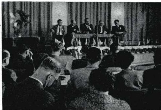
Het forum in actie

Toen vroeg men: ‚Hoe komt het dat zo vaak gezien wordt dat een filmer binnen enkele jaren aan de top komt en dan opeens weer in het niet verdwijnt’. Het forum antwoordde, dat de persoonlijke omstandigheden vaak de maker verhinderden verder te filmen. Het kan echter ook dat de filmer opeens leeg is aan ideeën. De Heer Eigensteyn vroeg aan het forum een profetie over geluid op 8 mm. Kleibrink bepleitte het gebruik van twee tamboers aan de 8 mm projector, waarbij de ene tamboer werd gebruikt voor het transport van de film, waarop het beeld was vastgelegd, terwijl de tweede tamboer geperforeerde magneetband moest voortbewegen, waarop het geluid dus automatisch synchroon met de film zou kunnen worden opgenomen en weergegeven. De Heer Veldman zag de toekomst in de gestripte film. De film zelf zou als drager voor de tape te stroef zijn. Op de tentoonstelling te Parijs zag hij een zeer mooi gekoppeld apparaat. Je kon kiezen welke tape-recorder je daarbij wilde gebruiken. Deze wordt dan gekoppeld aan de camera. Bij deze tweesporige tape wordt het ene spoor voor het geluid gebruikt en het andere voor de synchroniteit. De frequentie werd elektronisch van de camera op de tweede strook