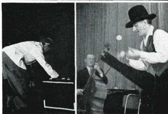
De clown met de koffer en de ballenjongleur.