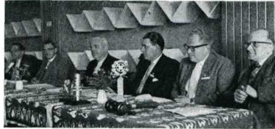
H. Het bestuur, met als symbool vele klippen boven zich. Ze werden prima omzeild! In de voorgrond de prijzen.

Het is een hachelijke onderneming om een kopie te laten maken door de grote kans op beschadiging, zoals de praktijk heeft bewezen. De kopieën van het vorig jaar bij een