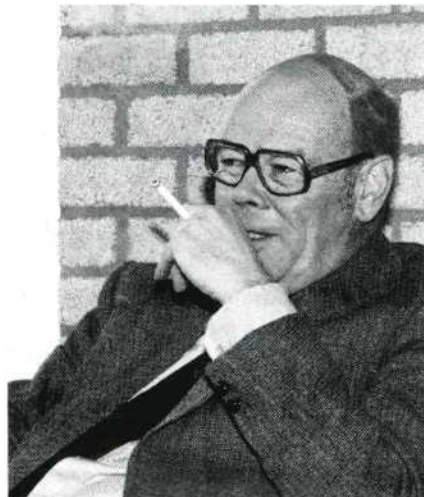
Ik vind communicatie het belangrijkste goed dat je in je leven hebt, dat maakt dat mensen met elkaar kunnen leven.

in-film-geïnteresseerde buitenwacht. Met de wat vergrote 'bemanning' (sorry!) kan het secretariaat (NOVA-kantoor) de taken wat vlotter aan, kan de post in veel gevallen met enkele dagen afgewerkt worden en komen piekbelastingen veel minder voor. Daarnaast ziet hij echt wel taken waaraan tot nu toe, door allerlei oorzaken, te weinig (of zelfs veel te weinig) gedaan kon worden.