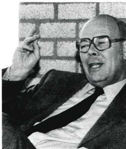
Amateurfilms vormen vrijwel allemaal, meer of minder duidelijk, een geloofsbelijdenisje.