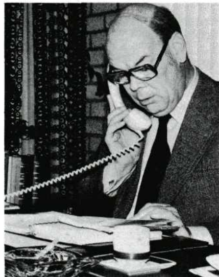
Dit is geen shot uit de Sterreclame of de heren de agenda's willen trekken. Veel gesprekken uit het buitenland worden in die landstaal gevoerd.

gemeente-HBS in Amsterdam. Verder, onder meer, de aanleg van nieuwe pie- ren in IJmuiden. Een vervolg behan- delde het gebruik van hydraulische portaalkranen bij spoorlijn-bouw in Zuid-Frankrijk. Gaandeweg worden zijn films beloond met prijzen, en ver- derop komen er nauwelijks meer... verdrongen door de functies in USA (Utrechtse Smalfilm Amateurs), NO- VA en UNICA. Zo gaat dat: filmen en organisatorisch werk blijken meestal moeilijk te combineren te zijn.