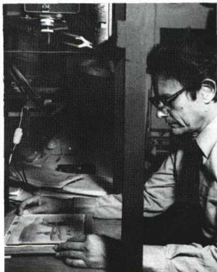
En aan de tructafel.