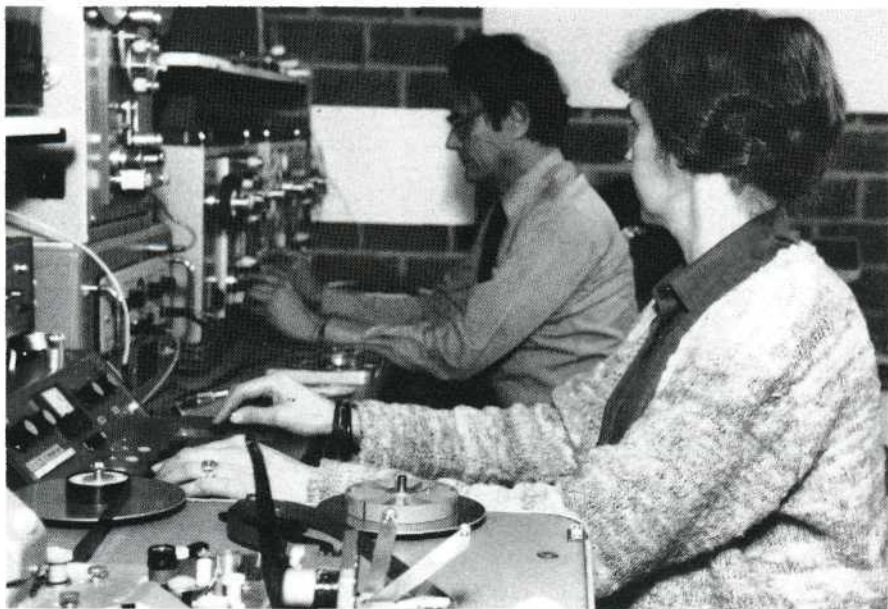
Samen in de studio aan de geluidsmontage.

Vera: 'Ja, het zal wel vreemd klinken, dat ik het zeg, maar ik houd niet van