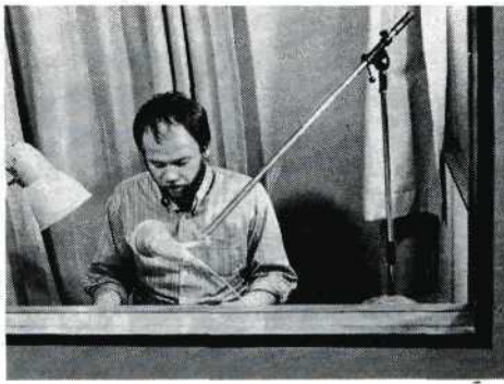
Ronald van der Most verzorgde voor de film tekst en commentaar.

Ook voor de instructie door middel van instructiefilms is een uitgebreid programma opgezet. Er zullen films komen voor beginners en voor gevorderden die uiteenlopende onderwerpen zullen behandelen. De eerste instructiefilm voor beginners is thans gereed gekomen onder de titel 'Ik zie... ik zie...'. De film behandelt een paar fundamentele aspecten van de opname- en montage-techniek met betrekking tot de eigenschappen van onze visuele waarneming. De film is afgestemd op de meest voorkomende beginnersfouten