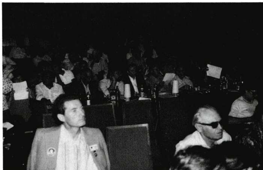
De jury in afwachting.