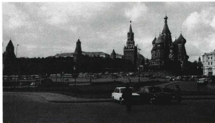
Het Rode Plein, op afstand, vanaf het hotel.

Aan elk deelnemend land stonden maximaal 90 minuten ter beschikking ten behoeve van projectie en 'eerste' jurering. Er hadden 18 landen ingezonden en dat leverde 108 films op. De formaten waren 16 mm, super 8 en standaard 8.