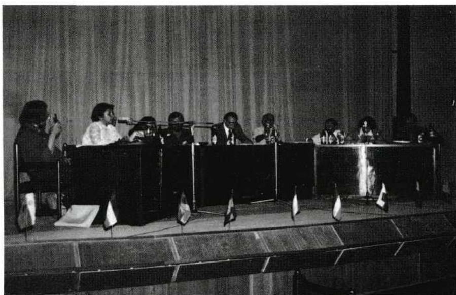
Openbaar juryberaad, met tolken.