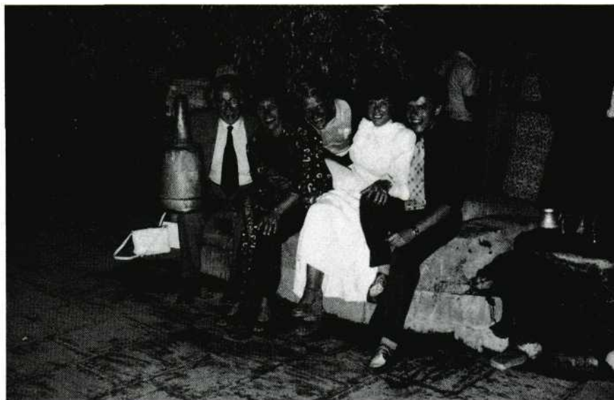
Het bestuur van GRUT '78.