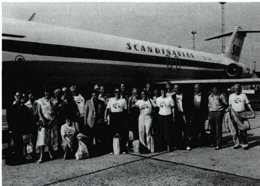
Het overgrote deel van de Nederlands/Belgische vertegenwoordiging, tijdens de terugreis, op het vliegveld van Kopenhagen.

peld, voorwáár geen gek idee. Dat de temperatuur in het algemeen hoger lag dan in Nederland was onverwacht en meegenomen. De grootste groep vloog heen op 9 augustus en terug op 19 augustus.