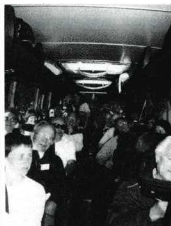
De bus met vaderlanders, die zich blootshoofds maar welgemutst op de schoolreisstoer bevonden.

je dat we ondernamen, waarbij de weergoden zich van hun beste zijde lieten zien. Op de grote boottocht over de Golfe de Morbihan, het gezelschap verspreid over vier boten, waar we voorzien werden van een houten lunchmand met alles d'r in. Op de voorplecht samen Franse, Duitse en Nederlandse liedjes zingen; 's avonds het grootse diner, dansen totdat een ieder zich uit kon wringen. De halve dagtocht naar de zoutpannen van Guérande, La Baule en Le Croisic en weer een diner. En wijn, wijn, wijn! De afscheidsavond in Mazy in La salle de Fête. . . enfin, dit Filmbeeld is te klein om alles te vertellen.