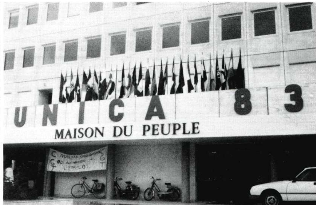
In het Maison du Peuple kwamen de filmvrienden uit vele landen bijeen.

Echter, in de loop der dagen verdwenen deze opmerkingen toen bleek dat de uitstapjes en de daaraan verbonden diners, verrassingen en presentjes subliem werden uitgevoerd. De kleine 'frapjes' waren spoedig vergeten. De stem-