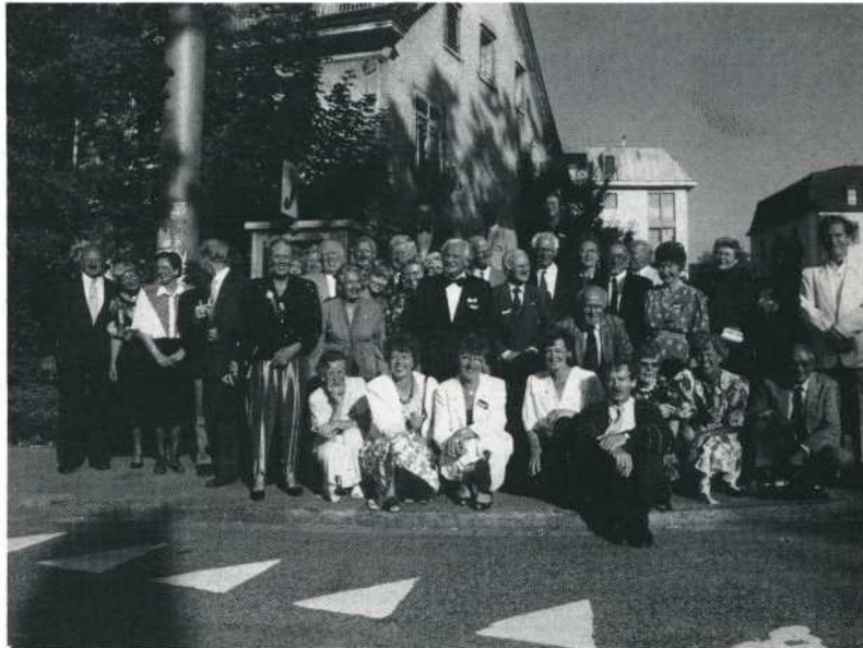
UNICA '91.

Een Nederlander, die voor het eerst naar de UNICA ging, vertrouwde me toe, dat hij er spijt van had dat hij niet al veel eerder mee was gegaan: 'Je kunt er veel van leren, de gesprekken met gelijkgestemde zielen zijn hoogst interessant en je komt met nieuwe ideeën naar huis.'