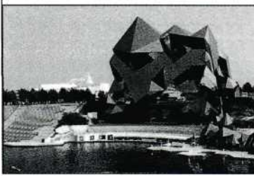
Het imposante "Le Kinémax" in Futuroscope.

UNICA '95 was een bijzonder festival. Ondanks de warmte in de zaal en het geringe succes van het Nederlandse filmprogramma was het zeer beslist een geslaagd festival. Volgend jaar is de NOVA gastheer (-vrouw?) voor het UNICA-gebeuren. Het organisatie-comité is reeds volop bezig om het festival voor zowel de filmers als de bezoekers zo aangenaam mogelijk te maken. U komt toch ook (weer)? Van de warmte zult u in het Theaterhotel (Almelo) in elk geval geen last hebben! ■