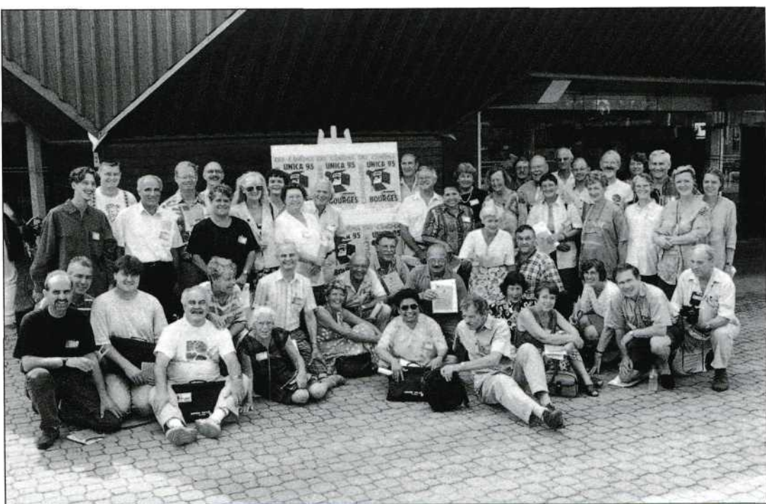
De Nederlandse groep.

Ook UNICA-president Max Hänsli pakt een stukje Hollandse kaas, bij de presentatie van UNICA '96.