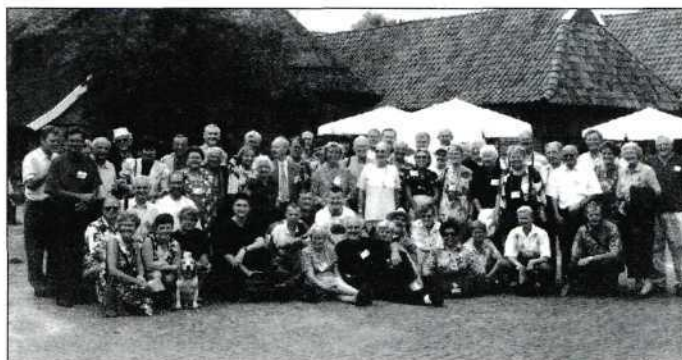
De Nederlandse deelnemers

Het organisatiecomité van UNICA 96 verdient niets dan lof. Zelden heb ik zo'n perfect festival meegemaakt. Geen kritiek? Ja! Hoe komen we af van het (tè) grote aantal films dat niet door de (Unica-) beugel kan? Het is, maar dat is al jaren zo, een probleem dat niet alleen bij de Unica ligt, maar vooral bij de betreffende landen. Dáár moet op kwaliteit gewaakt worden. Ik weet dat er door de Unica aan gewerkt wordt. Misschien zien we de resultaten volgend jaar in Polen en daarvan hoop ik u te berichten. Ik houd de vinger aan de pols! ■