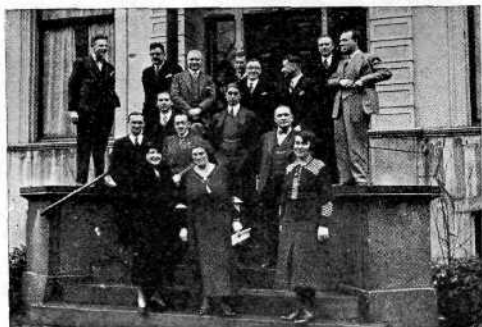
Jury en toenmalig Hoofdbestuur 1932 op de stoep van de N.V. Multifilm, ter gelegenheid van het grote Concours International.

De jaarlijks terugkerende Nationale Filmwedstrijd, bedoeld als toetssteen voor het filmpeil trok toenemende belangstelling, vooral toen deze ook werd opengesteld voor niet-leden. Door introductie van buitenlandse amateurfilms werd getracht de activiteit der leden te prikkelen en hun blik te verruimen, welk doel niet