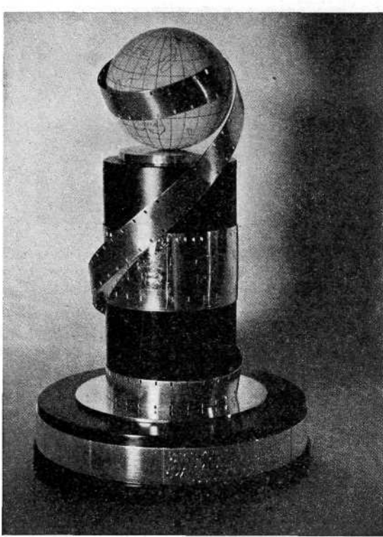
De grote Intern. Wisselprijs, door de Smalfilm Liga geschonken voor de Concours Internationaux.

oorlog ongeveer 2 x per jaar) aangezien de U.N.I.C.A. geleidelijk aan over meer films beschikte. In 1940 waren er reeds 32. Helaas zijn deze, op enkele na, door de oorlog verloren gegaan. Een nieuw archief is nu weder in voorbereiding, doch het gaat nu veel moeilijker!